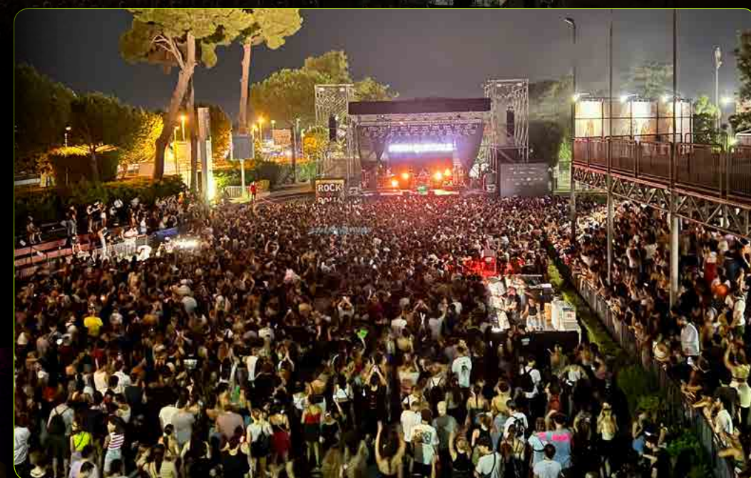
RED STAGE Capacity: -> Up To 6.000 / INFO