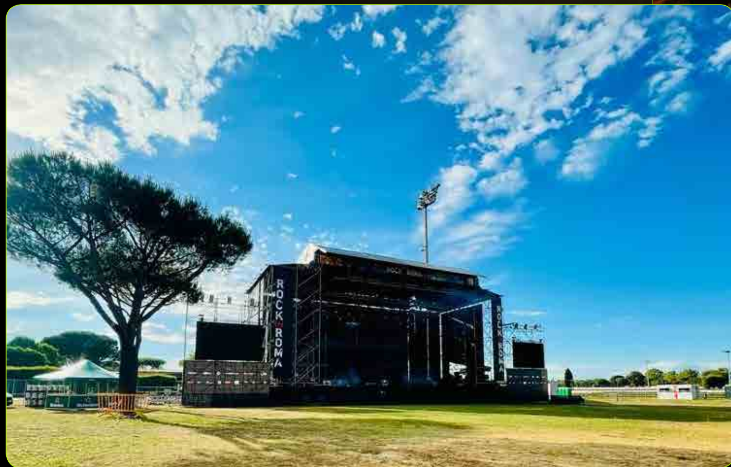
BLACK STAGE Capacity: -> Up To 35.000 / INFO